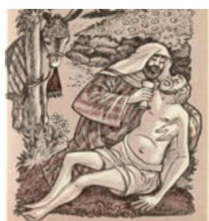
Fondazione Beato Tovini Antiusura