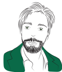
di Carlo Battistella per Adiconsum Verona

E che incidenza avrà il bando delle cannuce mentre si vendono a prezzi irrisori giganti gonfiabili che fluttuano nel mare una settimana e poi vengono abbandonati a lato di un cassonetto? Solo intervenendo sulla cultura del consumo è (forse) ancora possibile cambiare le cose. L'invito è quello di approfondire questo argomento complesso ed urgente; settembre è il mese giusto. ■