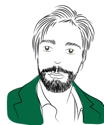
A cura di Carlo Battistella di Adiconsum Verona

mento dell'Antitrust, sostenendo che la responsabilità doveva essere attribuita solo alla Intermarket Diamond Business. Ma ecco la novità. Il TAR del Lazio con sentenza n. 10967 del 14 novembre 2018 ha respinto il ricorso della Banca e ha ribadito quanto rilevato dall'Autorità Garante: il Banco BPM ha avuto un ruolo attivo e determinante nella vicenda e deve ritenersi responsabile al pari di IDB. Un rimarchevole punto in più a favore dell'azione di tutela dei veronesi incappati in questo inganno che vedono ulteriormente legittimate le loro richieste di risarcimento. L'ultimo dato importante. Dagli incontri informativi organizzati da Adiconsum Verona sul territorio è risultato che, purtroppo, siano ancora molti i concittadini non consapevoli di quanto accaduto con i diamanti da investimento. Se nel vostro portafoglio finanziario avete queste pietre preziose, dunque, non esitate a presentare un reclamo alla vostra banca o a rivolgervi ad un'associazione consumatori. Per maggiori informazioni www.adiconsumverona.it